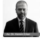
Av. Dr. Kerem Erhan