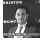
Av. Serif Emir Ekşi