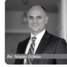
Av. Nagan Çökür