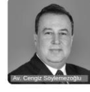
Av. Cengiz Soytemezoğlu